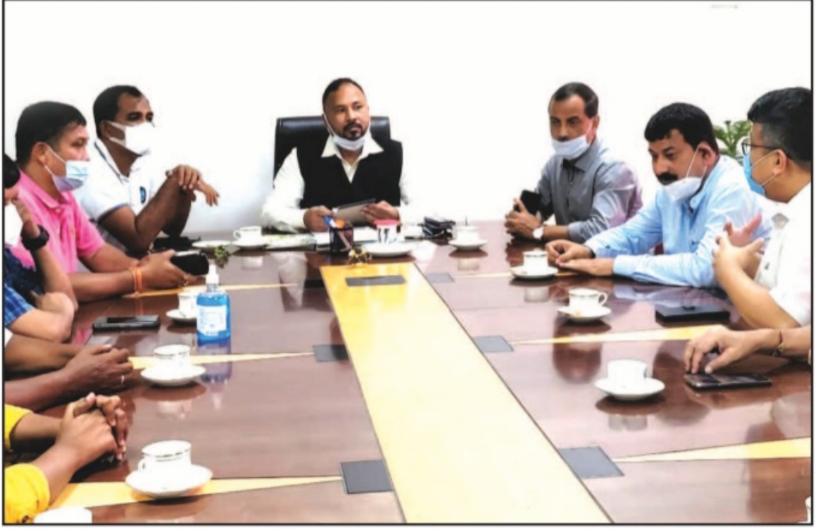
Assam Olympic Association Office bearers meet Sports Minister Bimal Bora at his Office Chamber on 7 th of June.