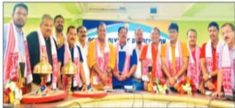
AOA felicitated assam sports organisers elected to Nation Sports Organization.