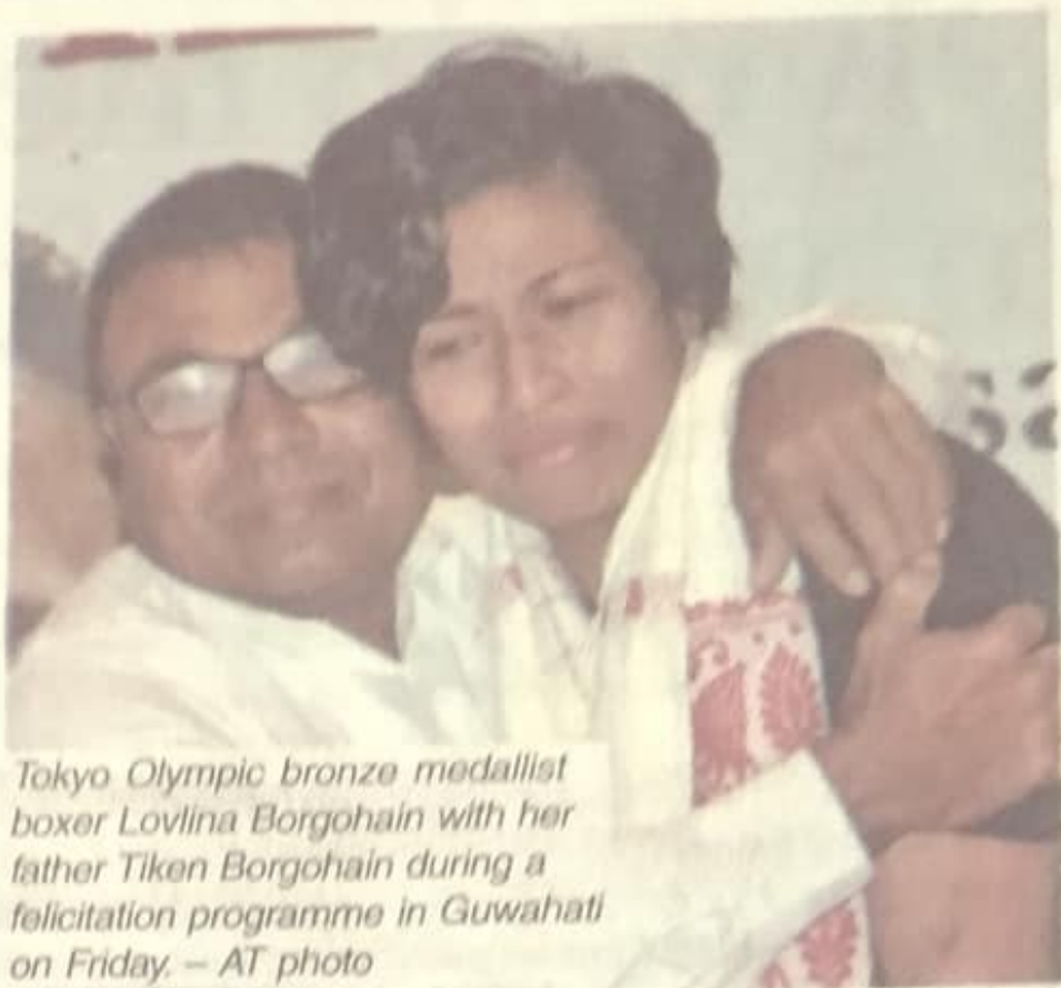
Tokyo Olympic bronze medallist boxer Lovlina Borgohain with her father Tiken Borgohain during a felicitation programme in Guwahati on Friday.