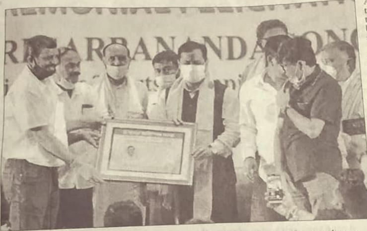
Assam Olympic Association Ceremonial felicitation to former Assam Chief Minister and Union Minister of Ports, Shipping & Waterways and AYUSH Sarbananda Sonowal at Taj Vivanta Hotel in Guwahati on Saturday.

Our Sports Reporter GUWAHATI, Aug 21: Assam Olympic Association felicitated Union Minister for Ports, Shipping & Waterways and AYUSH Sarbananda Sonowal in a function held in a city hotel here today. It was the maiden visit for Sonowal after he was inducted in Modi's cabinet.