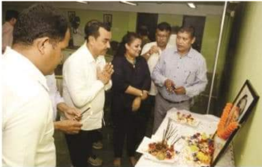
गुवाहाटी:राष्ट्रीय खेल दिवस के मौके पर असम ओलंपिक संघ ने हॉकी के दिग्गज मेजर ध्यानचंद को श्रद्धांजलि दी